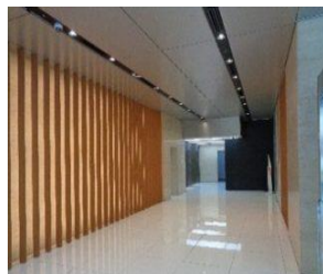
After【エレベータホール】