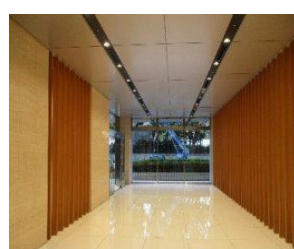
After【エレベータホール】