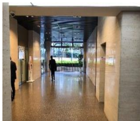
Before【エレベータホール】