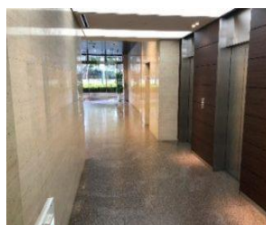
Before【エレベータホール】