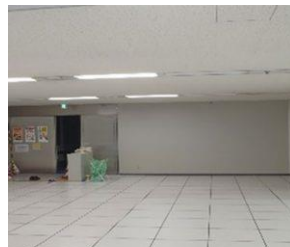
エントランス(施工前)