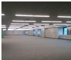
フロアー全景(施工後)