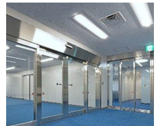
エントランス(施工後)