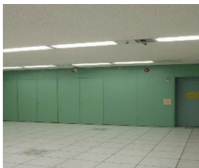
フロアー全景(施工前)