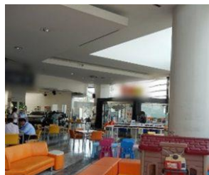
商談スペース(施工前)