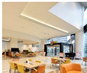
商談スペース(施工後)