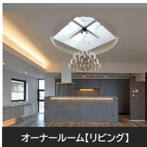
オーナールーム【リビング】