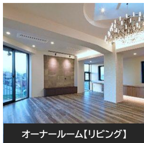
オーナールーム【リビング】