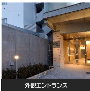
外観エントランス