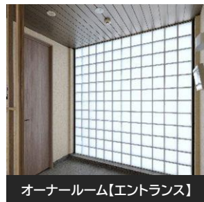
オーナールーム【エントランス】