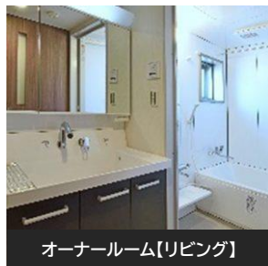
オーナールーム【リビング】