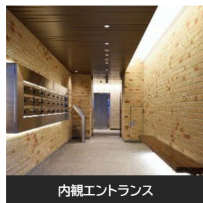
内観エントランス